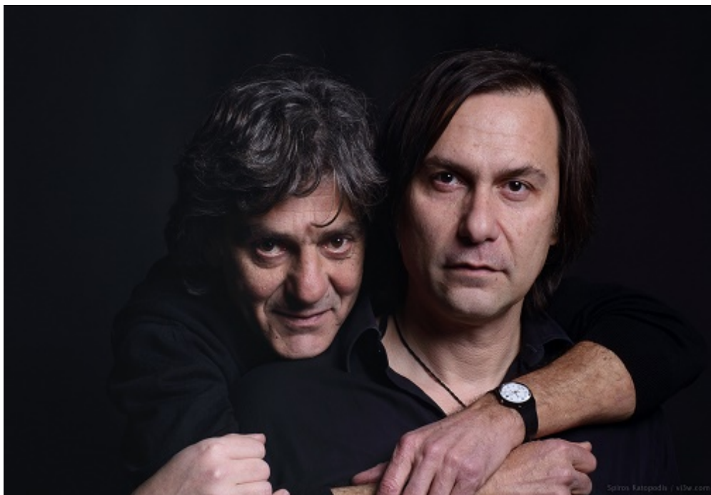
Με τον πρωταγωνιστή του «TATTOOLAND» Δημήτρη Αλεξανδρή.

* Σ' ένα εργαστήριο τατουάζ, κάποια χαράγματα ζωντανεύουν καθώς κεντιούνται πάνω σε ανθρώπινα σώματα διεκδικώντας μια θέση στη ζωή του δημιουργού τους. Μνήμες και αισθήσεις ζυπνούν επικίνδυνα. Μορφές και καταστάσεις ακροβατούν ανάμεσα στη φαντασία και στην πραγματικότητα, ανάμεσα στο «τόρα» και στα ασαφή σύνορα του χρόνου. Πού σταματούν τα γεγονότα και πού αρχίζει το όνειρο; Και τι από τα δύο συνιστά «ζωή»;